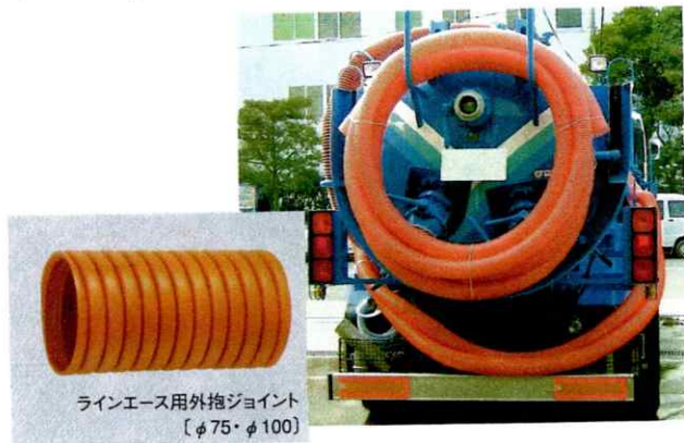
ラインエース用外抱ジョイント 〔φ75・φ100〕