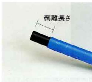
【表3】外層カバー剥離部分長さ