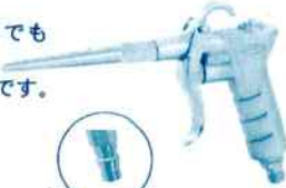
OPB(20型プラグ) もあります。